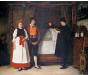
Seite 17 | Page 25