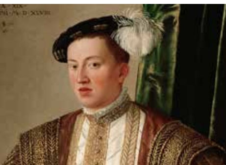
Seite 41 | Page 48