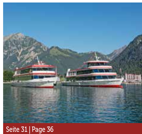
Seite 31 | Page 36