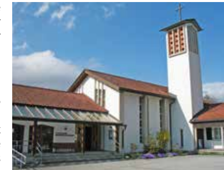
Seite 67 | Page 74