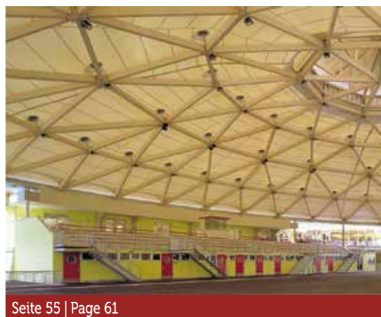
Seite 55 | Page 61