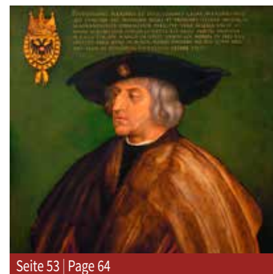
Seite 53 | Page 64

The 500th anniversary of Emperor Maximilian I's death is on 12 January 2019. Karl Lubomirski not only discusses this important Habsburg Emperor, but also the political, social and intellectual trends of an era that is now considered a turning point between the Middle Ages and the modern age.