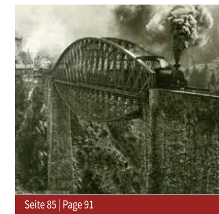
Seite 85 | Page 91