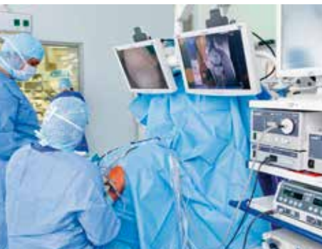
Seite 43 | Page 48

Even the most beautiful day's skiing can end with a fall and injury. But the Tyrol is equipped for these events too: top quality rescue service is guaranteed and surgery and rehabilitation are first class as well. Sonja Niederbrunner reports on this in her article „ High Performance Surgery in Skiing Paradise .“