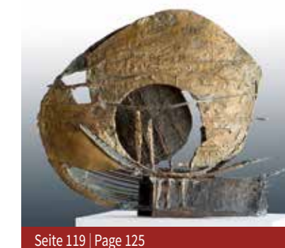
Seite 119 | Page 125