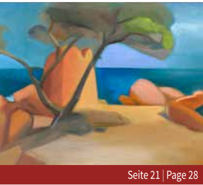
Seite 21 | Page 28